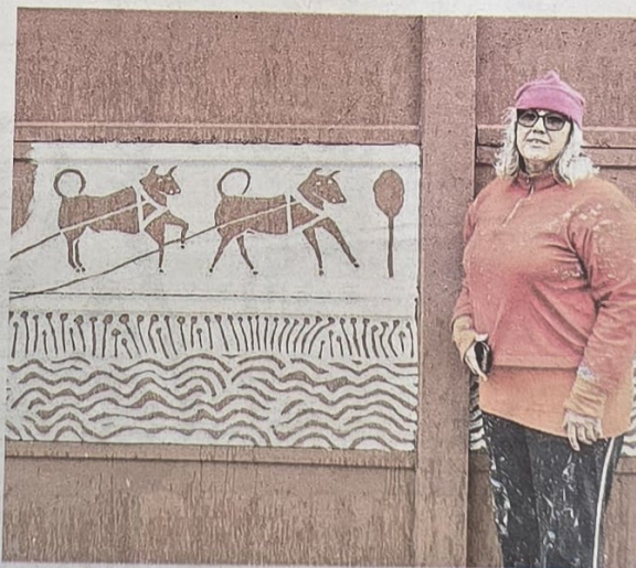
Oggi è prevista l'inaugurazione delle tre opere