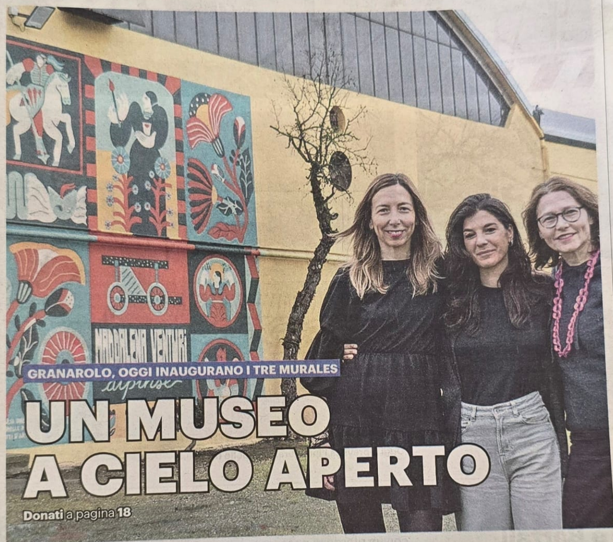
GRANAROLO, OGGI INAUGURANO I TRE MURALES

dialettale ca salute uardo al- e si dice- i n'è mēj te e bel i troppo sostene- utto, nel iù impor- risolveva cvèl' (La ai pove- a salute, o come a salut e salute e tendeva sotto i én u n'si lino non el sacco on la si varne fa-