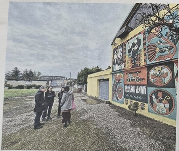
Uno dei tra grandi murales